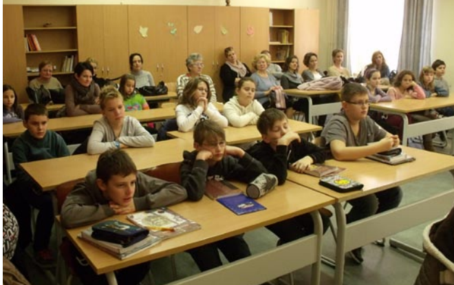
Irodalom óra a 6.c osztályban

2. Kisgimnazisták nyílt napja. A hagyománnyá váló program – az iskola megnyitja kapuit a negyedik osztályos kisdíákok és szülei előtt – jól sikerült. A szaktanárok a „leendő Gárdonyisokat” is bevonták a tanórák menetébe, motiválva ezzel a kisdíákokat. Az 5.C osztályosok a nap végén a Dzsungel könyve c. színdarabból adtak elő egy részletet nagy-nagy szeretettel a vendégeknek. A programon mintegy 60 kisdíák vett részt.