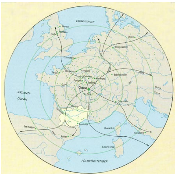
a ciszterci rend terjesztése a 12. és a 13. században: ● a reform fő központja ● egyéb ciszterci alapítványok → a ciszterci reform terjedése — téri út vonalak □ az albigenes eretnek között ciszterci igehirdetés helye

A XIII. század második felében változóban volt az a világ, hiszen a pápaság a viaskodó politikai érdekek áldozatává válik, a városok gyors fejlődésnek indultak, megszülettek az első egyetemek, a szellemi életben megerősödött a racionalizmus, s ennek nyomá-