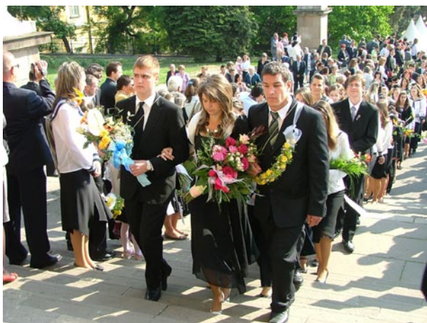
A 13.A osztály

„Az elmúlt 5 év nagyon gyorsan eltelt. Ahogy végiglapozom az osztály fényképalbumát, végigperegnek előttem a programok, a különböző események és a sok kirándulás.