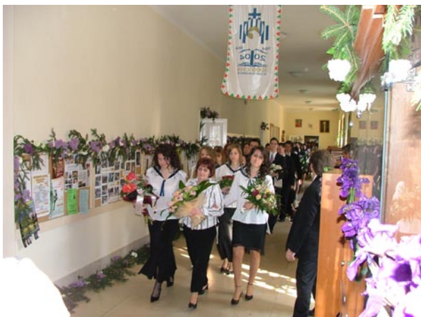
A 13.K osztály

Az „osztályfőnöki óra” után az osztályok a kisharang jelzésére elindultak az iskola folyosóin az udvaron keresztül végig a Széchenyi utcán a bazilikába. Menetüket élén az iskola lobogója haladt, négytagú fúvós zenekarral, amely ballagási dalokat játszott. Útjukat a diáktársaik sorfala jelezte.