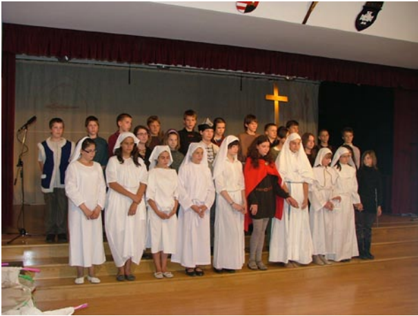
29. A csíksomlyói zarándoklat.