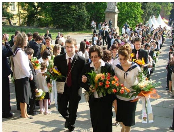
A 12.B osztály