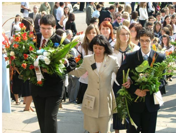
A 12.C osztály

A szentmisét Szabó József atya celebrálta, prédikációjában jó tanácsokkal látta el a ballagókat, melyből a legfontosabb: „... amelyben azonban egy életen keresztül bele lehet kapaszkodni: „Íme, én veletek vagyok minden nap a világ végezetéig.”